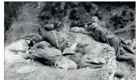
Po porážce SNP pokračovaly boje „po partyzánsku“ v horách

Již v přípravě a v průběhu povstání se projevila nejednotnost a vzájemná nedůvěra komunistických (v čele s Gustavem Husákem) a nekomunistických účastníků odboje, v jehož politickém vedení – Slovenské národní radě – byly zastoupeny obě skupiny. A ty rozhodně neviděly budoucnost stejně, lišily se názory na slovenskou autonomii v rámci Československa a komunisté dokonce koketovali s připojením k Sovětskému Svazu. I to přispělo k vojenskému neúspěchu povstání. A hned po válce se rozhořel boj o zásluhy na SNP a jeho interpretaci. Zejména komunistická historiografie dělala vše pro to, aby si SNP „přivlastnila“ a tím legitimizovala své postavení. V podání komunistů mizela řada jmen a základních informací, důraz byl kladen na roli ilegálního výboru Komunistické strany