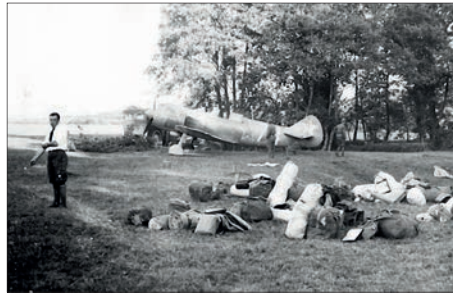
Polní letiště Zolná, odkud operovali čeští letci na sovětských strojích La-5FN

SNP bylo po řadu měsíců konspirativně připravováno v armádních kruzích Slovenského štátu s ohledem na předpokládanou válečnou porážku Německa. Měl to být vlastně státní převrat, odstranění proněmeckého luďáckého režimu a přihlášení se zpět