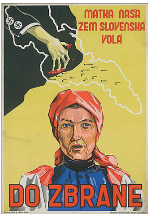
Dobový plakát, vyzývající k ozbrojenému odporu

před 80 lety, v zimě 1944 – 1945, dohasínala v horách středního Slovenska ozbrojená vzpoura, která vešla do historie pod názvem Slovenské národní povstání (SNP). Mojí generaci bylo SNP spíš pro smích, neboť v tom, jak se prezentovalo, jsme intuitivně cítili až příliš bombastické propagandy a manipulace s fakty; tušili jsme, že skutečné děje a osudy jeho aktérů se ztrácejí za nánosy ideologické omáčky. Docela rádi jsme sice pochodovali slovenskými horami „po stopách hrdinů SNP“, ale