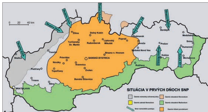
Celková situace na počátku povstání

V létě 1944 zintenzivnil na Slovensku partyzánský odboj, řízený převážně ze SSSR; jeho vůdci o plánech povstalců věděli, ale nehodlali je zohledňovat. Záškodnické akce partyzánů tak představovaly pro chystané vojenské povstání spíše komplikaci: když se totiž ukázalo, že Slovenský štát situaci nezvládá, Němci na žádost prezidenta Tisa přikročili 29.8.1944 k vojenskému obsazení