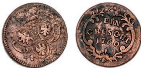
Vlevo avers grešle Marie Terezie se třemi znaky zemí Koruny české. Vpravo revers grešle Marie Terezie. Uprostřed hodnota mince „Ein Greschl“ a pod ní rok ražby 1760. Vše v barokním ornamentu

Země, které přistoupily k této dohodě, začaly razit také své zemské mince – ty se však