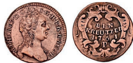
Vlevo avers krejcaru Marie Terezie. Vpravo revers krejcaru Marie Terezie, na němž je hodnota mince „Ein Kreuzer“, rok ražby 1761 a „P“ – značka pražské mincovny.

V následujících letech docházelo jen k drobným změnám a základní systém konvenční měny zůstal zachován ještě po další desetiletí.