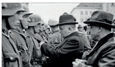
Prezident Tiso vyznamenává příslušníky SS po obsazení Banské Bystrice

země. To si vynutilo okamžité zahájení povstání jaksí mimo plán, když byla Rudá armáda ještě v nedohlednu – a v nastalém zmatku se do něj zapojila jen menší část slovenské armády. Vojensky bylo povstání poraženo již po dvou měsících, ale skupinky bojovníků proti fašismu se uchýlily do nepřístupných horských oblastí